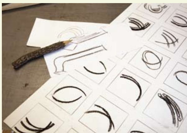
Dessin à main levée